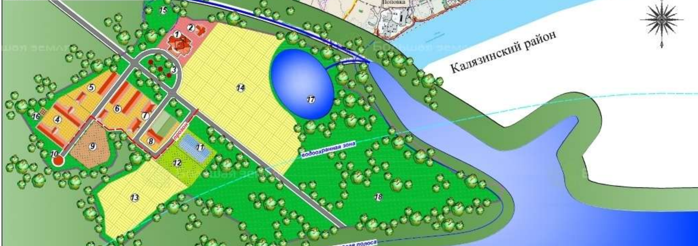
Схема организации земельного участка М 1:3000